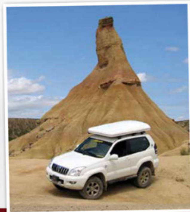
■ La Colombus en Espagne. Cela tombe bien car elle n'aime pas trop la pluie.