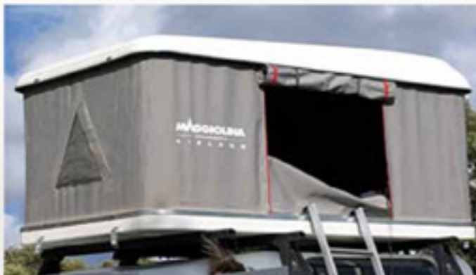
■ Les barres de toit Rhinorack sont considérées comme les meilleures pour supporter les tentes de toit à coque rigide à condition que la visserie de la tente soit adaptée.

Il n'est pas rare que la partie supérieure d'une Maggio se déforme sur les côtés, notamment lorsque