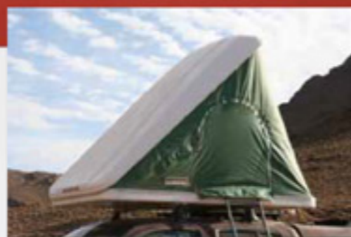
■ On remarque le manque de tension de la toile sur la Classic qui conserve d'année en année le même aspect fripé.

Le carénage de la coque est aussi bien profilé que celui de la Maggolina. La forme est harmonieuse avec un léger renflement à l'arrière qui permet de mieux optimiser le volume de rangement. La coque supérieure dispose d'une bague de finition qui fait tout le tour de la tente. Cette bague a souvent tendance à se décoller et, dans le cadre d'une évolution en forêt, elle s'accroche facilement aux branches et elle casse. Il faut le savoir, cette fameuse bague assure en partie l'étanchéité de la tente lorsque le véhicule roule. A vitesse élevée, sur autoroute notamment, si cette bague est absente, il peut arriver que la coque supérieure « gonfle » et se déforme. Dans ce cas, la toile risque de déborder de la coque. Si cela arrive, il ne reste plus qu'à ranger tout ce qui dépasse et quitter l'autoroute dès que possible. Autre solution, pour pallier à ce problème récurrent : installer des attaches sur les côtés pour y faire passer des sangles afin de maintenir la coque supérieure. Un bidouillage