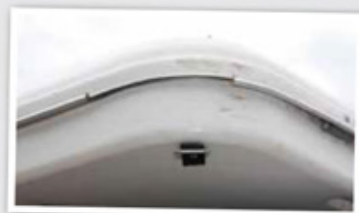
■ Traditionnel sur toutes les tentes de Zifer ! L'enjoliveur de la coque supérieure ne tient pas et casse aux angles.

Aubagne, où il dispose d'une antenne dynamique et réactive, l'atelier a installé trois fixations qui empêchent l'ouverture intempêtive du rabat. Il n'en resta pas moins que sous l'effet du vent, ce fameux rabat ne cesse de ballotter et là nous en arrivons au deuxième problème de cette tente, le manque de tension de la toile d'où l'aspect chiffonné qui apparaît nettement dès que l'on ouvre la tente. Rappelons que l'imperméabilité d'une tente tient à la qualité du tissu, bien sûr, mais aussi à la tension de la toile. Outre le fait qu'elle résiste mieux au vent, une tente bien tendue ne fera pas beaucoup de bruit et surtout, elle retiendra moins l'eau en cas de fortes précipitations. Avec la Variant, on aura donc intérêt à avoir le sommeil lourd et il faudra évoluer dans des pays où il ne pleut pas ! - le troisième modèle, la Colombus Carbon, reprend exactement les mêmes spécificités (et les mêmes défauts) de la Variant. La différence tient dans la couleur de la toile qui est d'un gris plus foncé et dans le matériau utilisé pour la coque, à savoir la fibre de carbone. Ce modèle, qui avoisine tout de même les 3 000 €, est plus léger que les autres modèles de la gamme. Le tout est de savoir si les 12 kg de différence méritent vraiment un écart de 1 000 à 1 500 € par rapport au modèle Classic ou au modèle Variant.